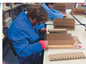
Travailler dans le conditionnement