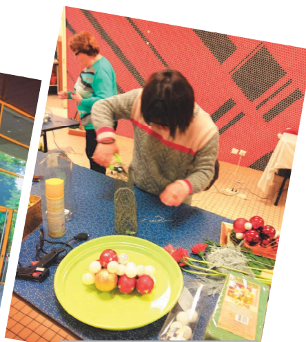
Fanny fait de l'art floral