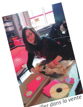
Travailler dans la vente