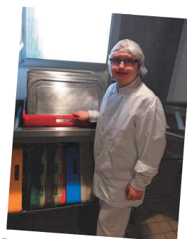
Travailler en cuisine collective

Les stages nous aident à savoir comment il faut se comporter en entreprise. On développe des compétences professionnelles pour avoir ensuite un travail, un salaire et une vie autonome avec une vie de famille. Le Saismo21 continue à nous accompagner lorsque l'on a un travail.