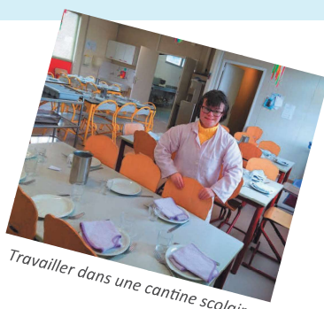
Travailler dans une cantine scolaire