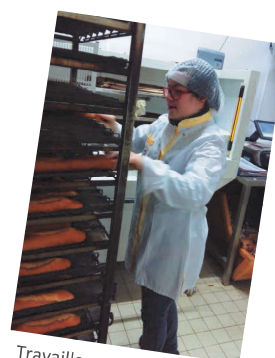
Travailler en boulangerie